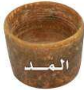
(مقدار المد باللتر = ٦٨٧ مليلتر)

عن أنس رضي الله عنه قال: «كان رسول الله صلى الله عليه وسلم يتوضأ بالمد، ويغتسل بالصاع، إلى خمسة أمداد» (١). ماذا تفهم من هذا الحديث؟