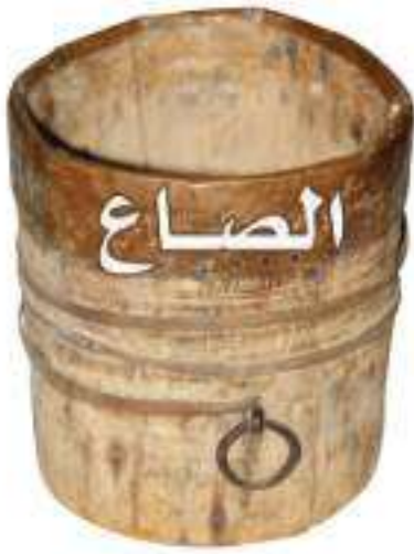
(مقدار الصاع باللتر = ٢,٧٤٨ لترا)